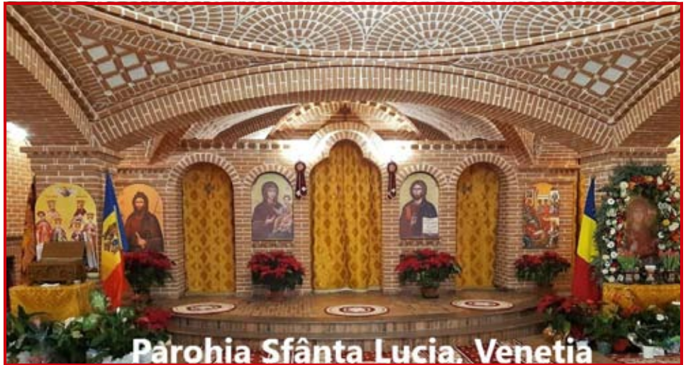
Parohia Sfânta Lucia, Venetia

Potrivit hotărârii Sfântului Sinod al Bisericii Ortodoxe Române, din ședința sa de lucru din 28 octombrie 2019, anul 2021 a fost declarat în Patriarhia Română ca fiind Anul omagial al pastorației românilor din afara României și Anul comemorativ al celor adormiți în Domnul; valoarea liturgică și culturală a cimitirelor.