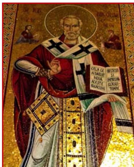
Icoană în mozaic pe catapeteasma Catedralei Naționale

Sfântul Nicolae, arhiepiscopul, s-a făcut tuturor „îndreptător credinței și chip al blândeților”, model de viațuire păstoritorilor lui. Dar fiindcă la cârma imperiului roman erau împărații prigonitori