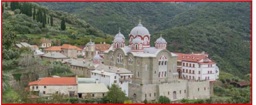
Mănăstirea Sf. Prooroc Ilie din Athos

Rămâne orfan de tată, dar va studia la Academia duhovnicească din Kiev (întemeiată de Mitropolitul român Petru Movilă). Nu termină însă studiile, atras fiind de viața monahală și considerând că nu mai poate pierde ani la Școala din Kiev. În 1740 îl aflăm în mănăstirea Liubețki, apoi se