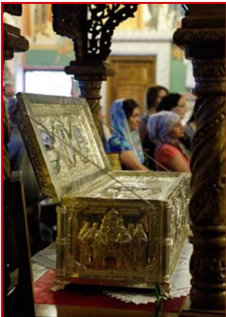
Racla cu moaștele Sf. Paisie din biserica noastră